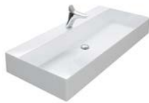
KERAMIEK 600 | 800 | 1020 | 1220 | 1420 | 1612 MM

460 MM DIEP | 3 WASTAFELBLADEN | 8 WASTAFELKASTEN