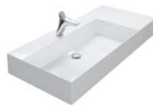
KERAMIEK ASYMMETRISCH 810 | 1020 | 1220 MM